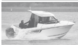
Merry Fisher 605