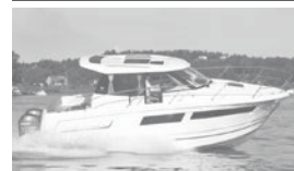
Merry Fisher 855