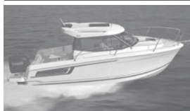
Merry Fisher 695