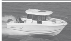
Merry Fisher 755 marlin