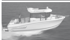
Merry Fisher 695 marlin